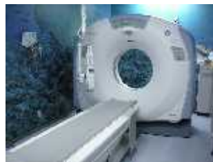
16列マルチスライスCT

ご予約・ご相談は、 地域医療連携課までお問い合わせください。 TEL 042-343-1311 FAX 042-347-3150