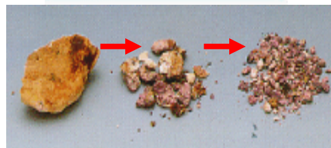
衝撃波により砂状になった結石