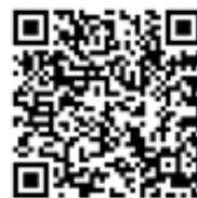
携帯サイトQRコード